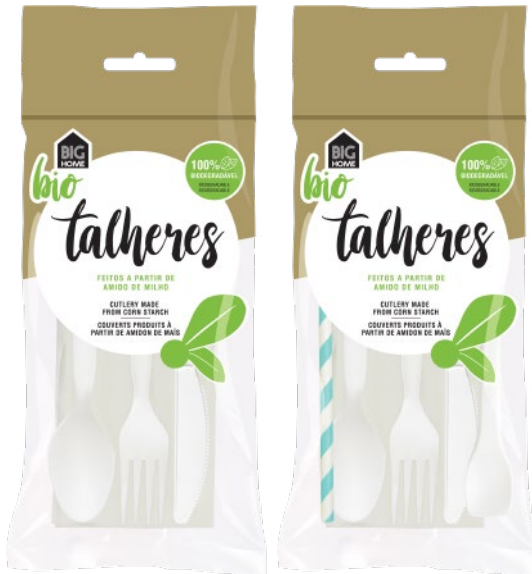
Kit Garfo + Faca + Colher Sopa + Guardanapo Fork + Knife + Spoon + Napkin Set Kit Fourchette + Couteau + Cuillère à soupe + Serviette cod. 483 | 4 un | EAN 5602109002418 | 12 un