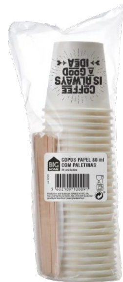
Copo Café Papel 80 ml/3 oz com Paletina de Madeira Coffee Paper Cup with Wooden Stirrer Coupe Papier Café avec Agitateur en Bois cod. 507539 | 24 Un | EAN 5602109100091 | 12 Un