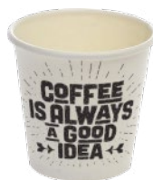
80 ml | 3 oz