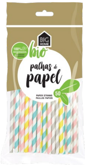
Palhas de Papel Biodegradáveis Biodegradable Paper Straws | Pailles Papier Biodégradables cod. 4353 | 50 Un | EAN 5602109018716 | 12 Un