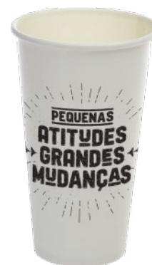
250 ml | 9 oz