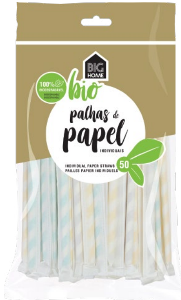
Palhas de Papel Individuais Biodegradáveis Biodegradable Individual Paper Straws | Pailles Papier Individuels Biodégradables cod. 4354 | 50 Un | EAN 5602109018723 | 12 Un cod. 458 | 1000 Un | EAN 5602109700321 | 1 Un