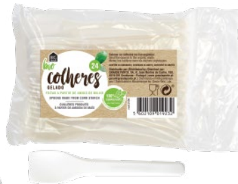
Colheres Gelado Biodegradáveis | Biodegradable Icecream Spoons | Cuillères à Glacé Biodégradables cod. 2590 | 24 Un | EAN 5602109019232 | 50 Un Individuais/Individual/Individuels cod. 2591 | 100 Un | EAN 5602109019249 | 10 Un