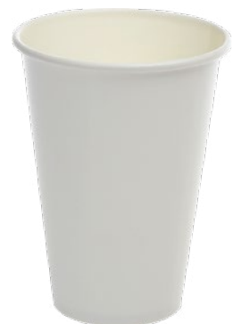
350 ml | 12 oz