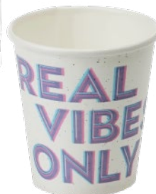
150 ml | 5 oz